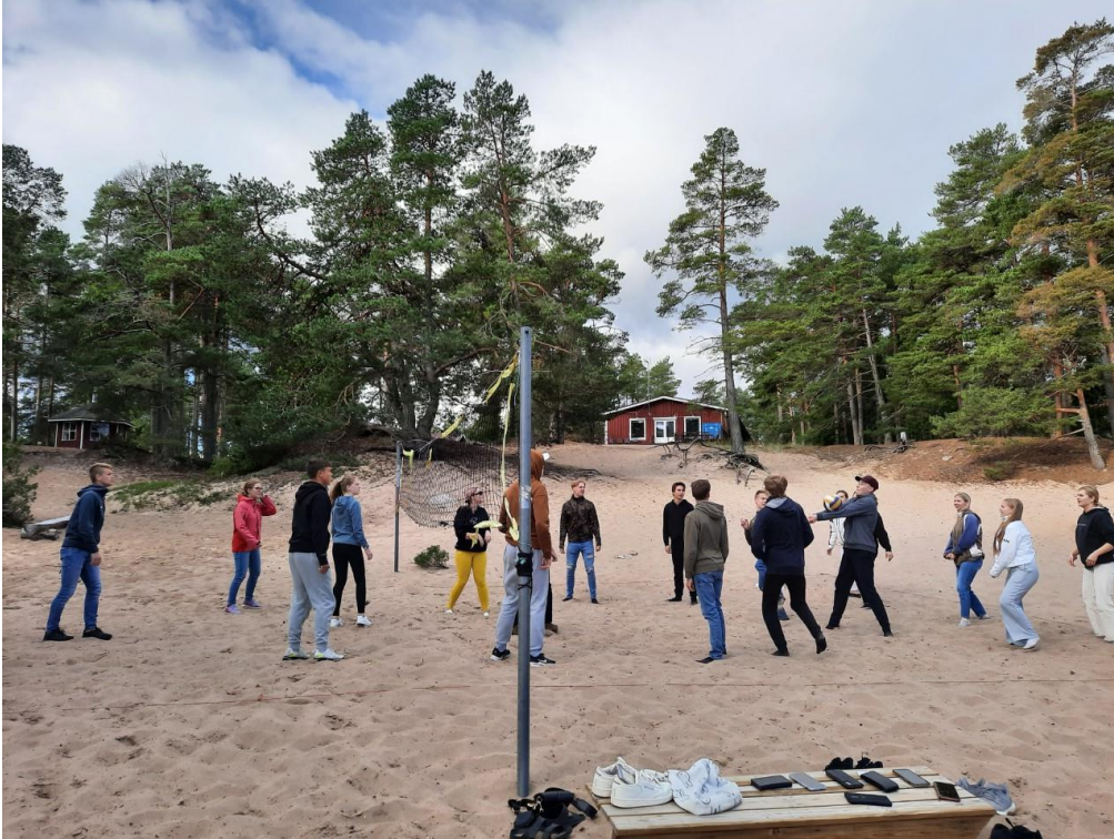
Vierailu huipentui rantalentopalloon sekä saunomiseen ja uimiseen Itämeren aalloissa.