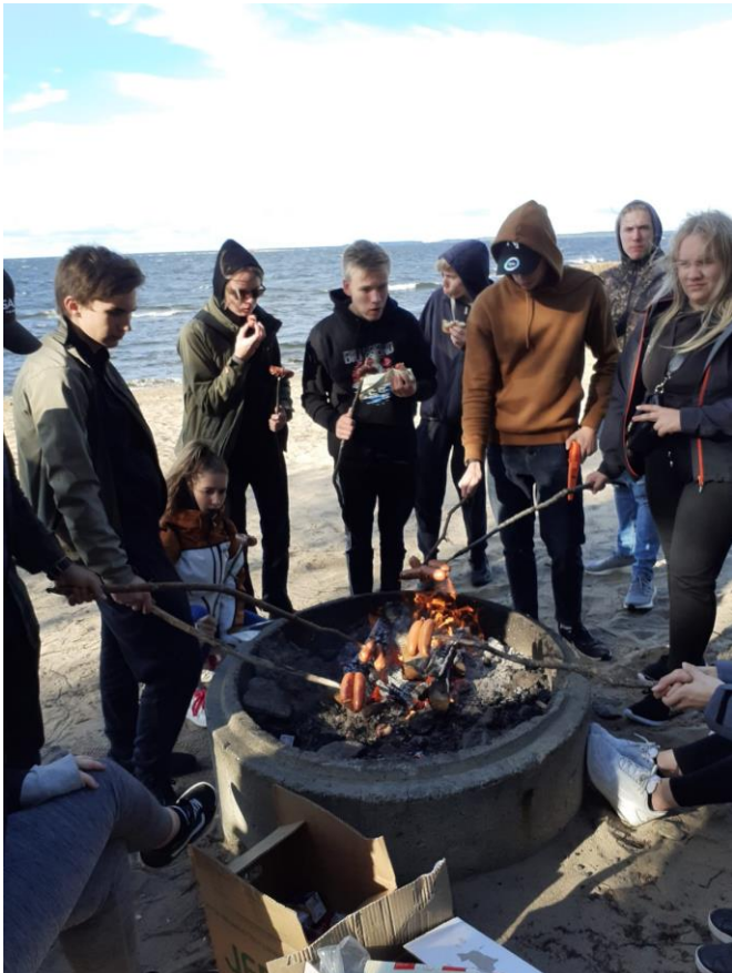
Viimeisenä iltana ohjelmassa oli makkaranpaistoa Pohjanlahden rannalla.