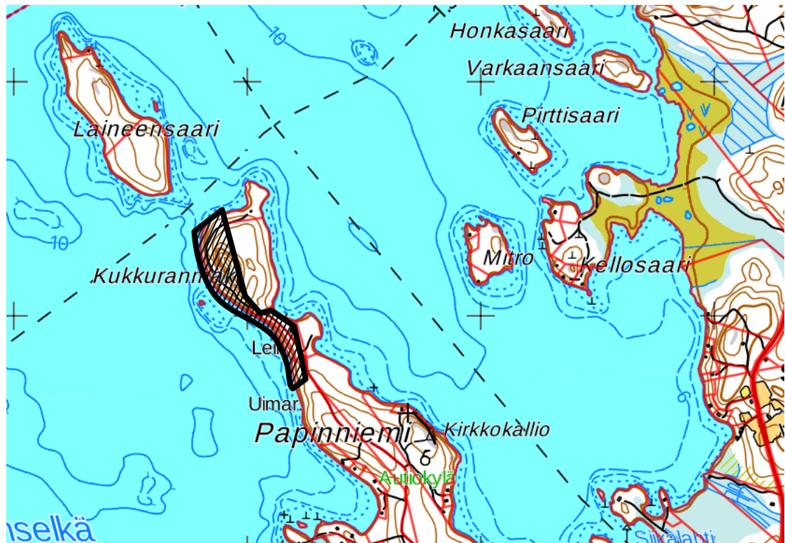
Kuva 1. Kaavamuutosalueen likimääräinen sijainti (musta rajaus)