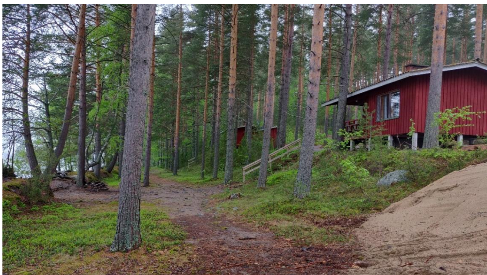
Kuva 5. Suunnittelualueen lomamökkejä.