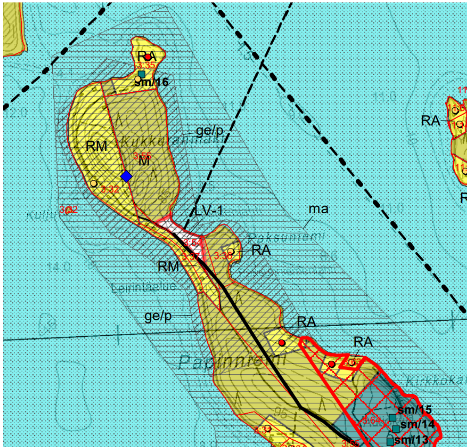
Kuva 8. Ote Uukuniemen osayleiskaavasta. (Parikkalan kunta)