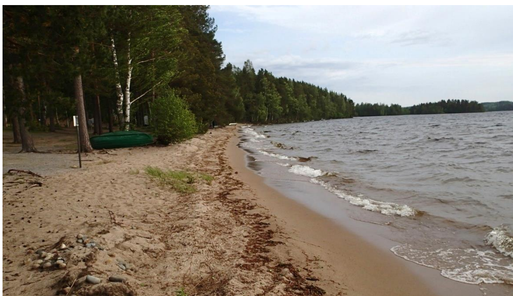
Kuva 4. Suunnittelualan luonnonympäristöä.