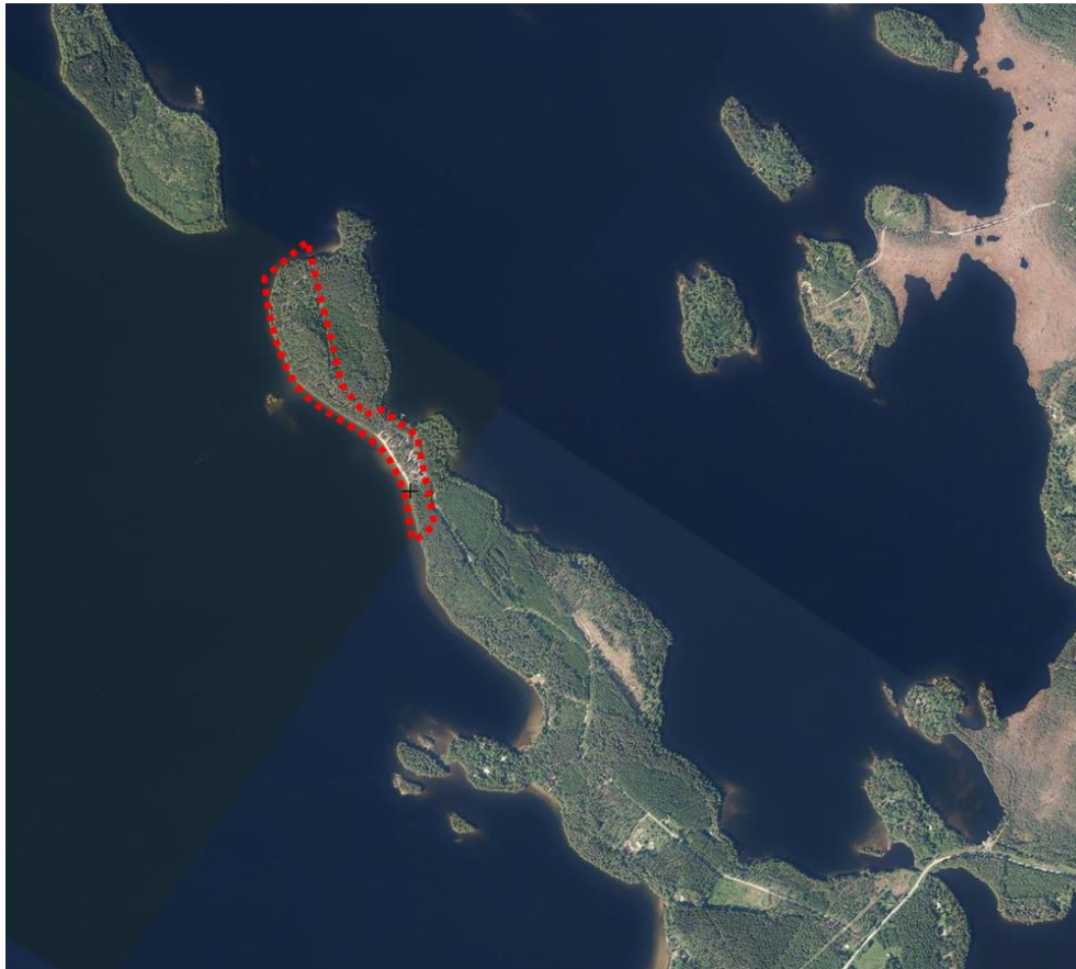
Kuva 2. Ortokuva suunnittelualueelta. Suunnittelualueen likimääräinen raja esitetty punaisella katkoviivalla