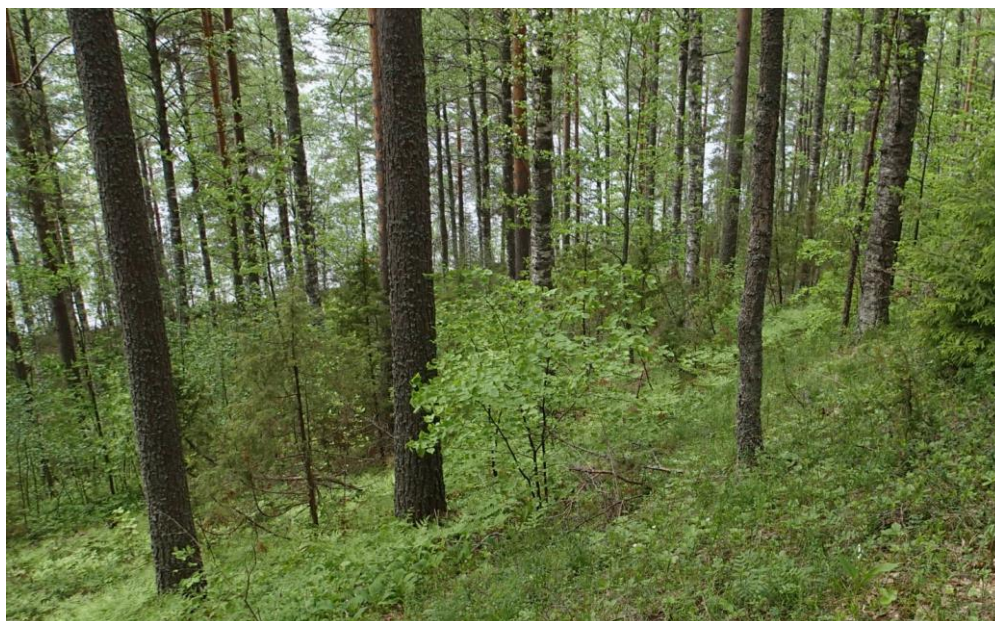
Kuva 3. Suunnittelualan luonnonympäristöä.